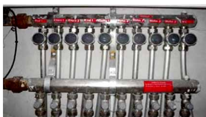
Herz laiton chromé