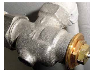
Herz TS dès 1978