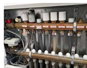
Divers autres types