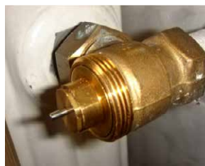
Herz TS jusqu'à 1978