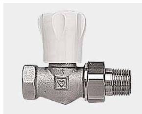
Herz GP-T dès 1992